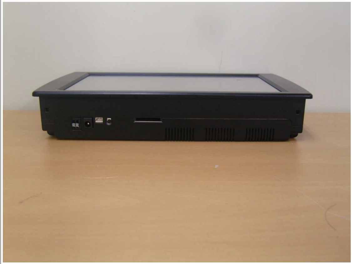
외부사진 - 측면3