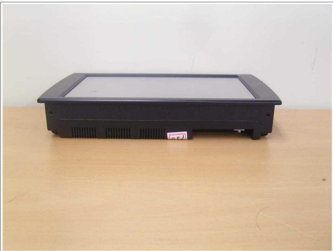
외부사진 - 측면4