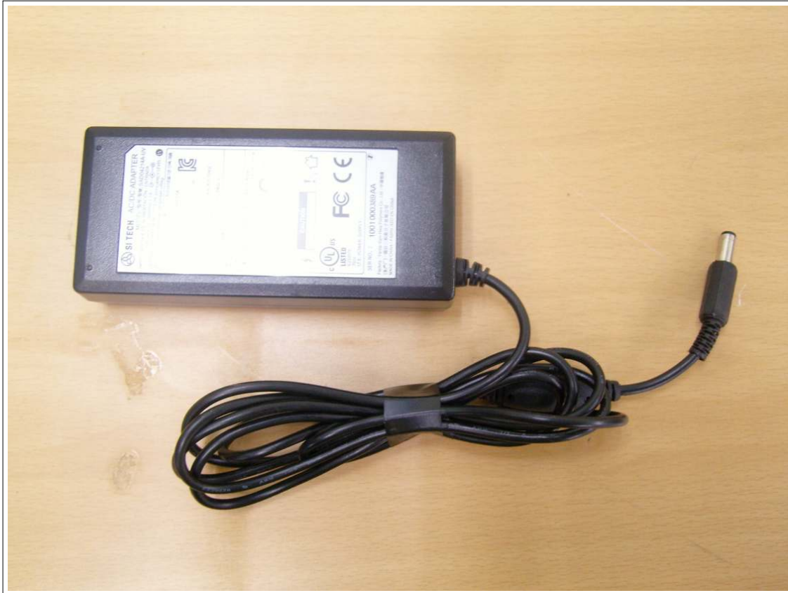
외부사진 - 직류전원장치