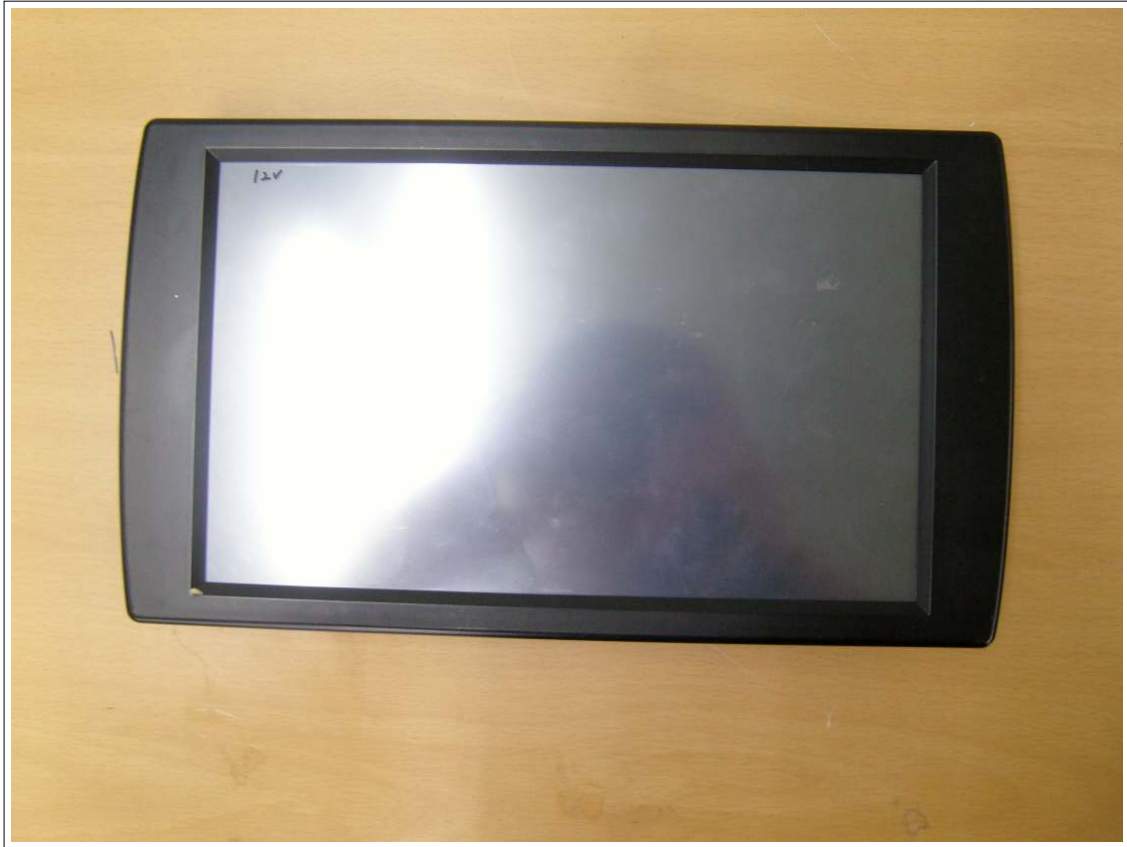
외부사진 - 전면