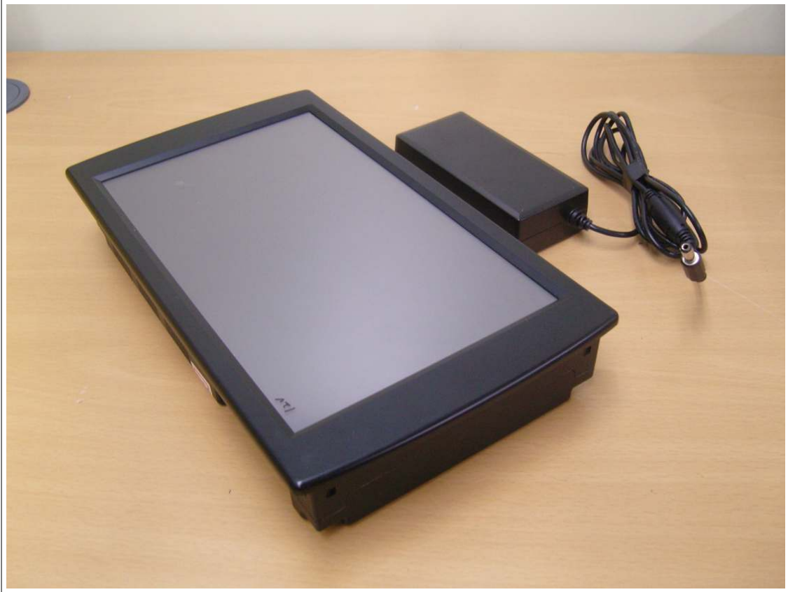
외부사진 - 측면1