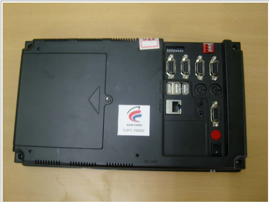
외부사진 - 후면