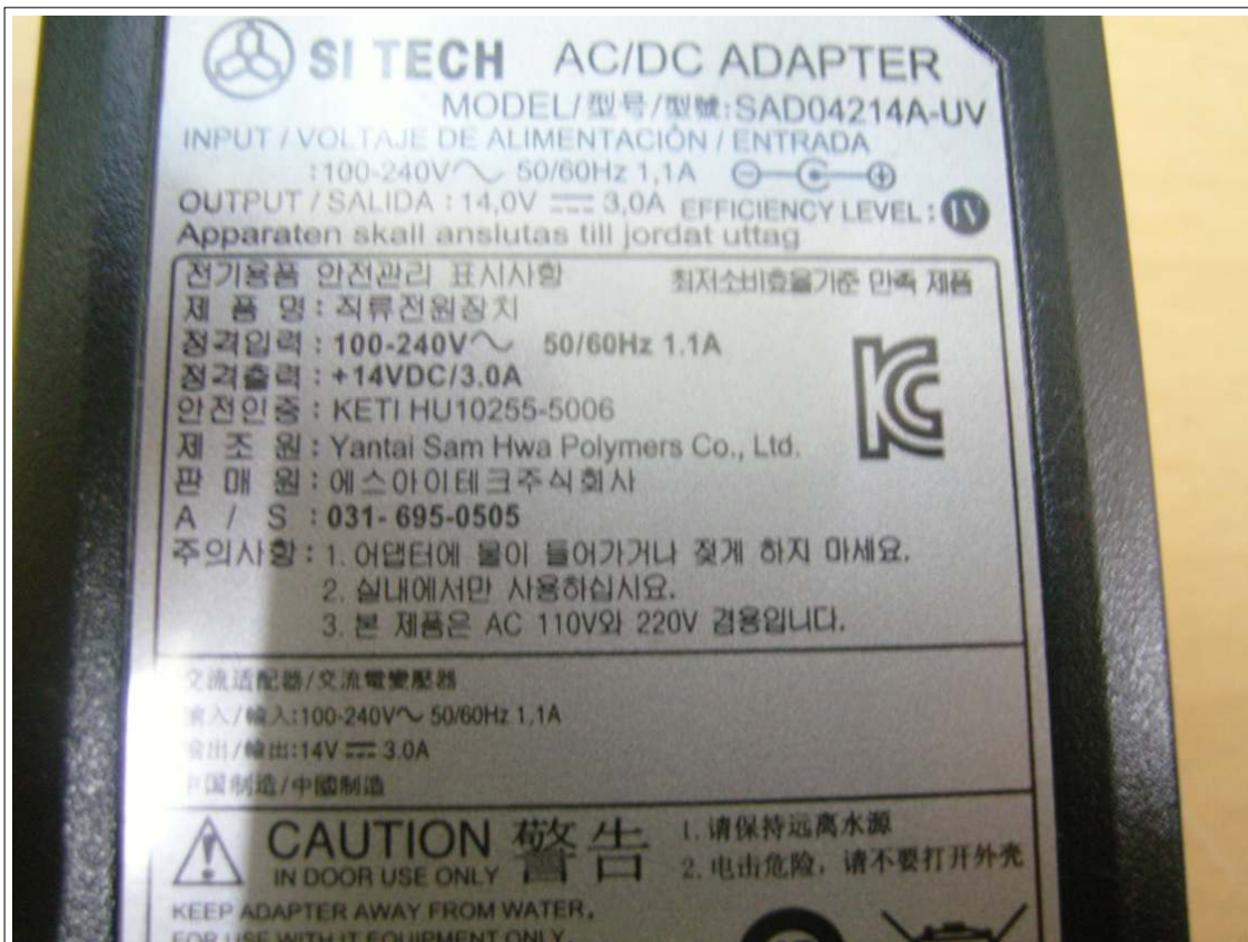
외부사진 - 직류전원장치 - 라벨확대