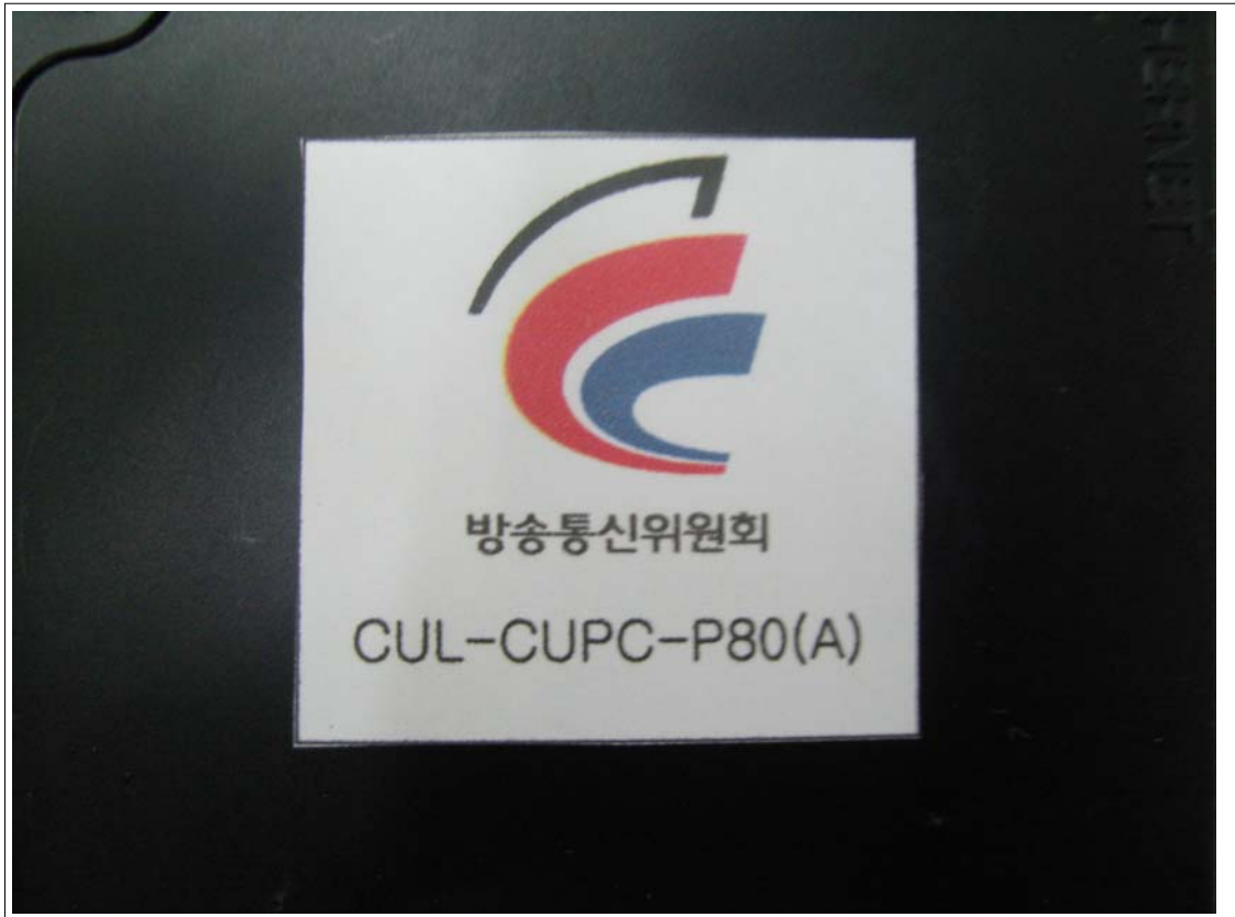
외부사진 - 라벨