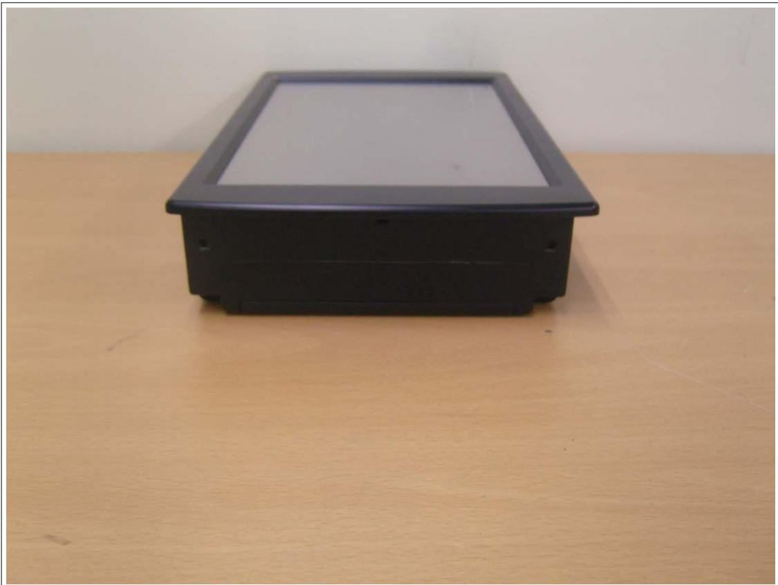
외부사진 - 측면6