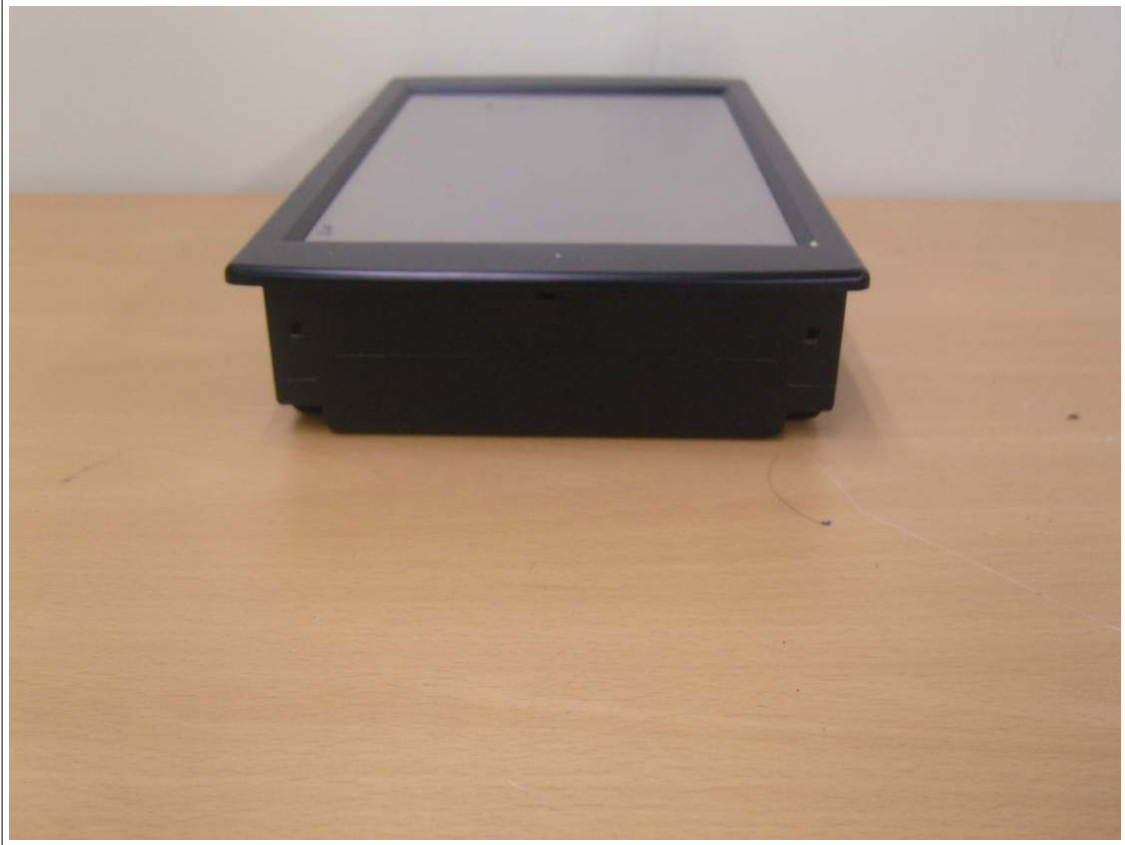
외부사진 - 측면5