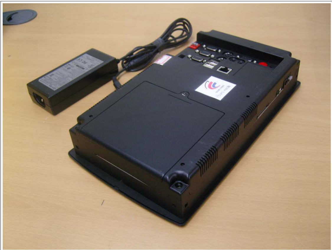
외부사진 - 측면2