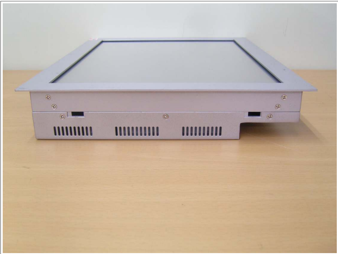
외부사진 - 측면6