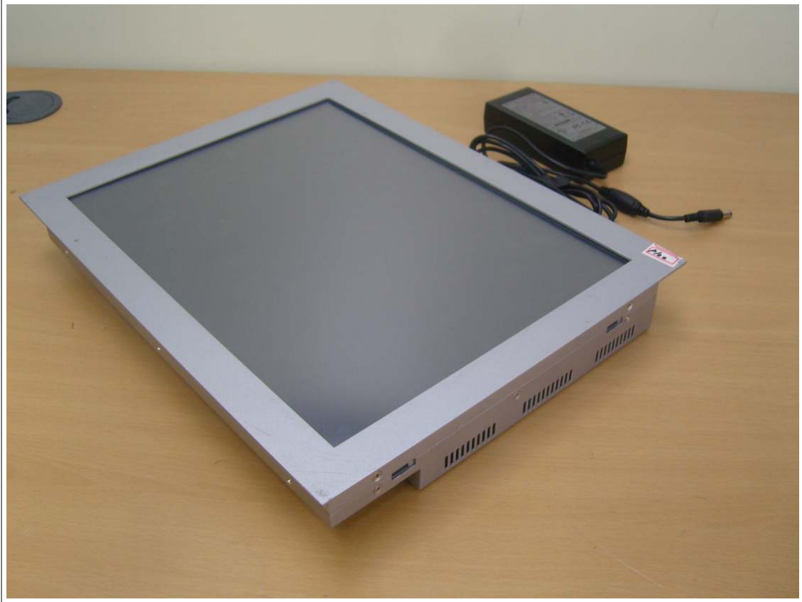
외부사진 - 측면1