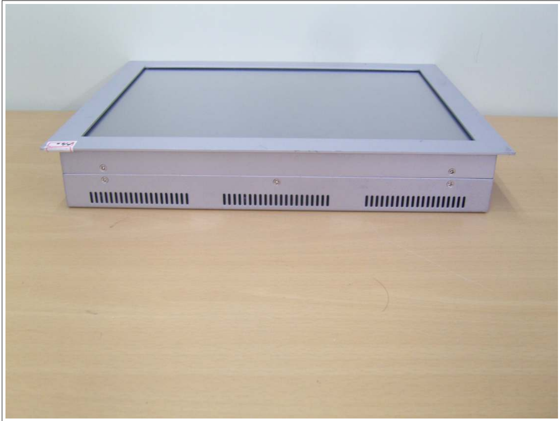
외부사진 - 측면3