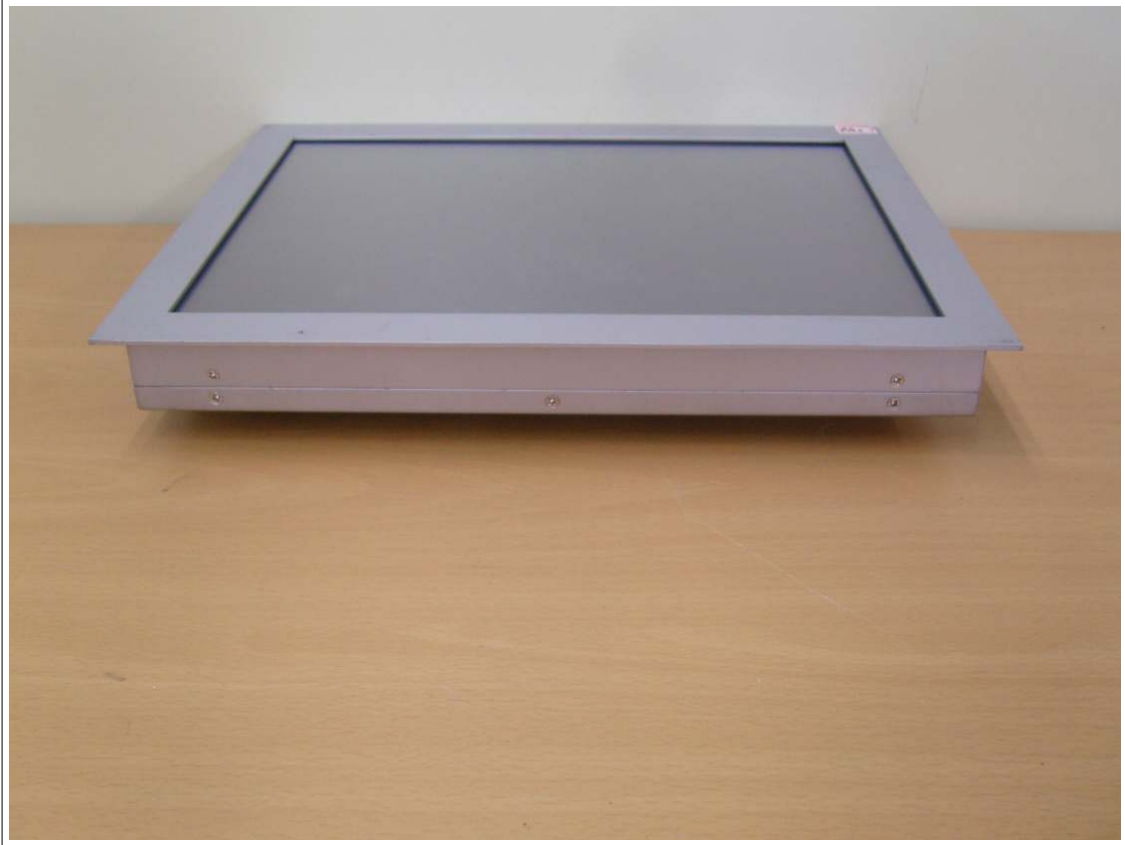
외부사진 - 측면5