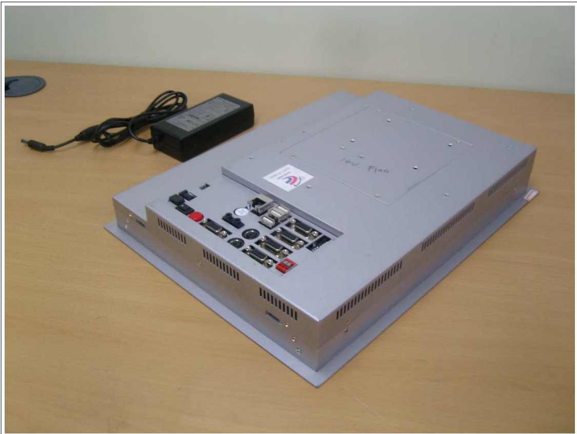
외부사진 - 측면2