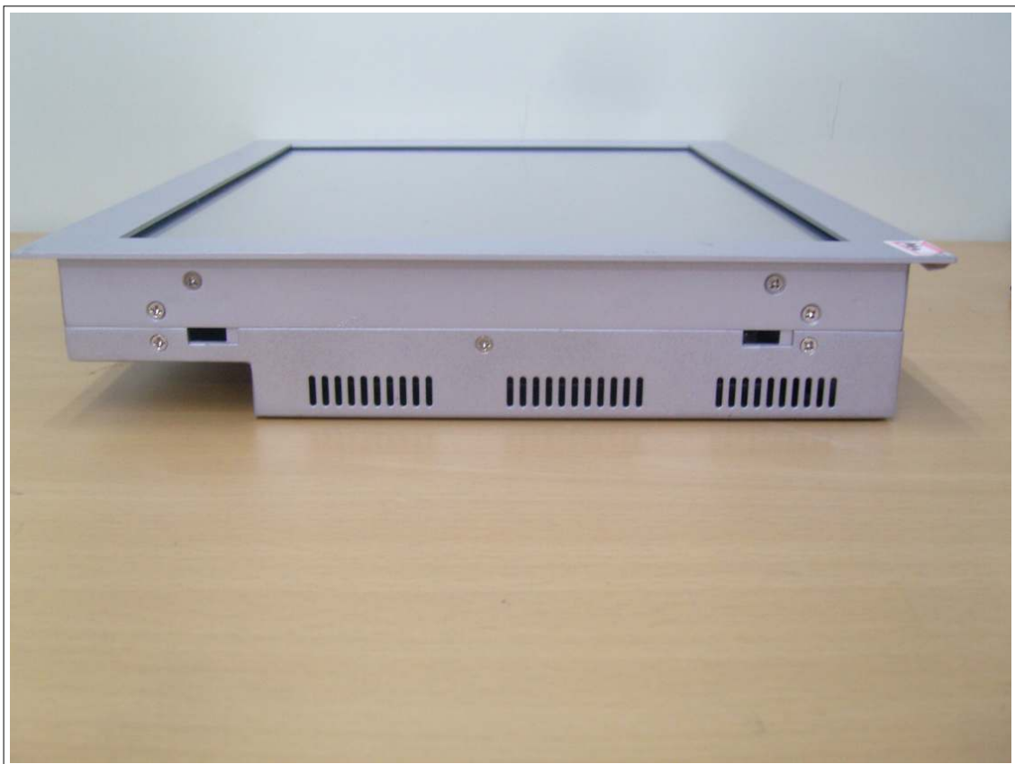
외부사진 - 측면4