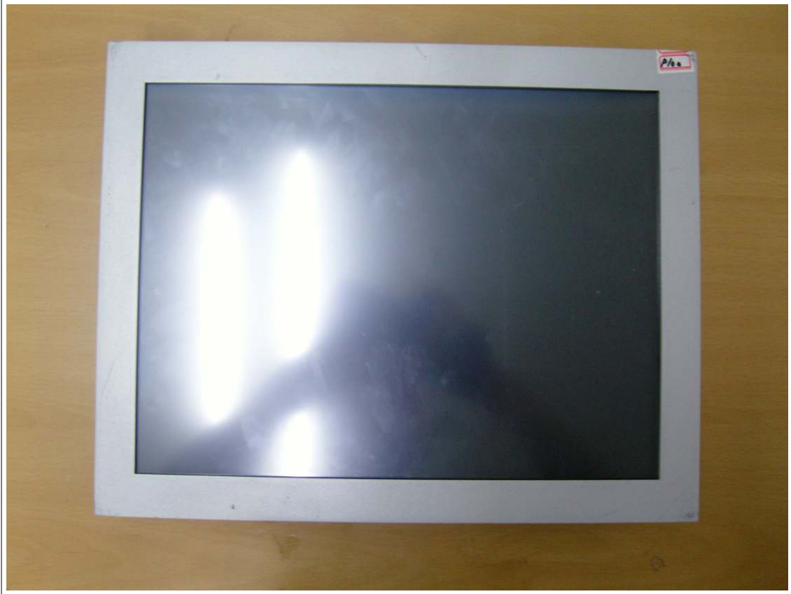
외부사진 - 전면