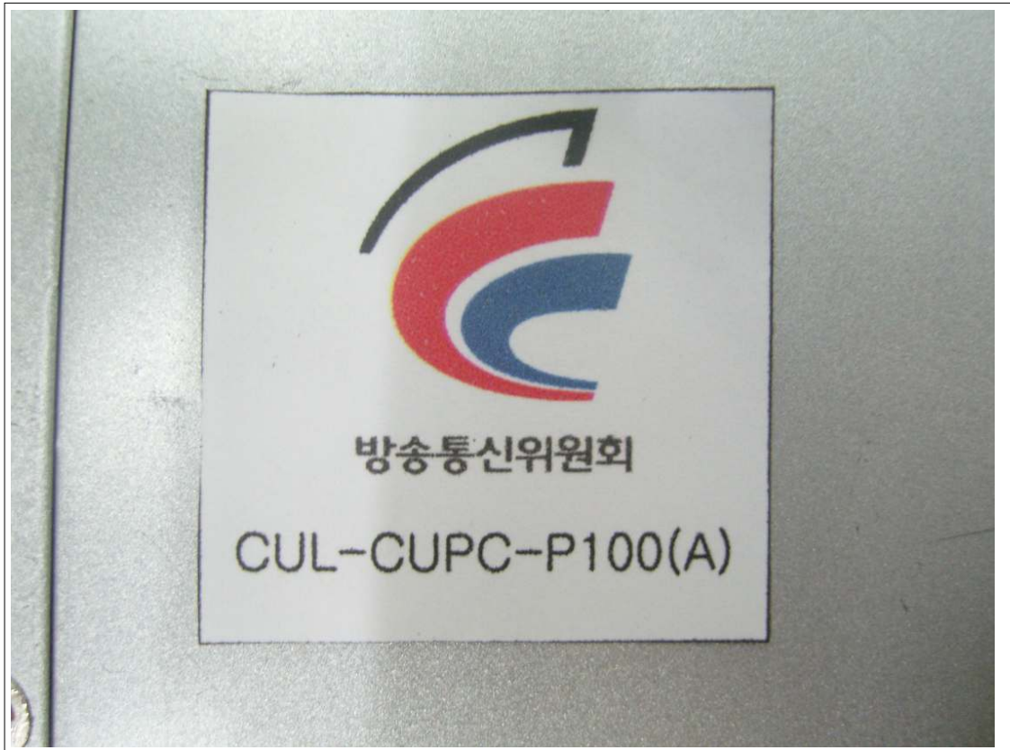
외부사진 - 라벨